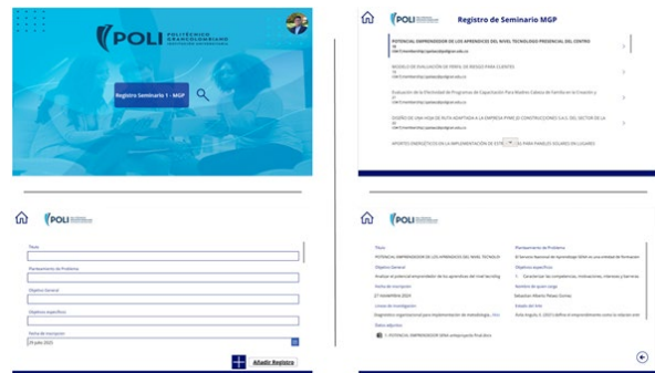
Figura 2. Visual del aplicativo de Power Apps.