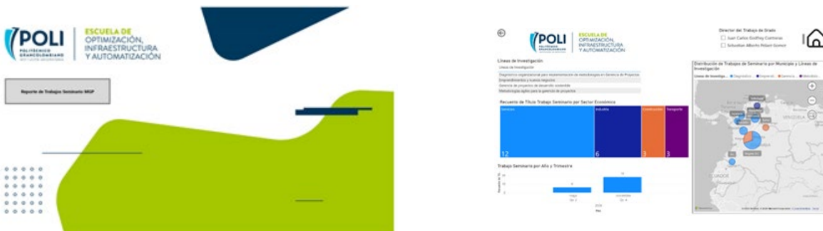
Figura 3. Visual del tablero de business intelligence.